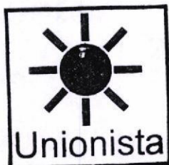
LIC. ALVARO ENRIQUE ARZÚ ESCOBAR SECRETARIO GENERAL PARTIDO UNIONISTA

TRIBUNAL SUPREMO ELECTORAL AUDITORÍA A ORGANIZACIONES POLITICAS Unidad Especializada de Control y Fiscalización de las Finanzas de los Partidos Políticos RECIBIDO 14 FEB 2023 Hora 17:20 Firma [Signature] Nombre 38 folios.